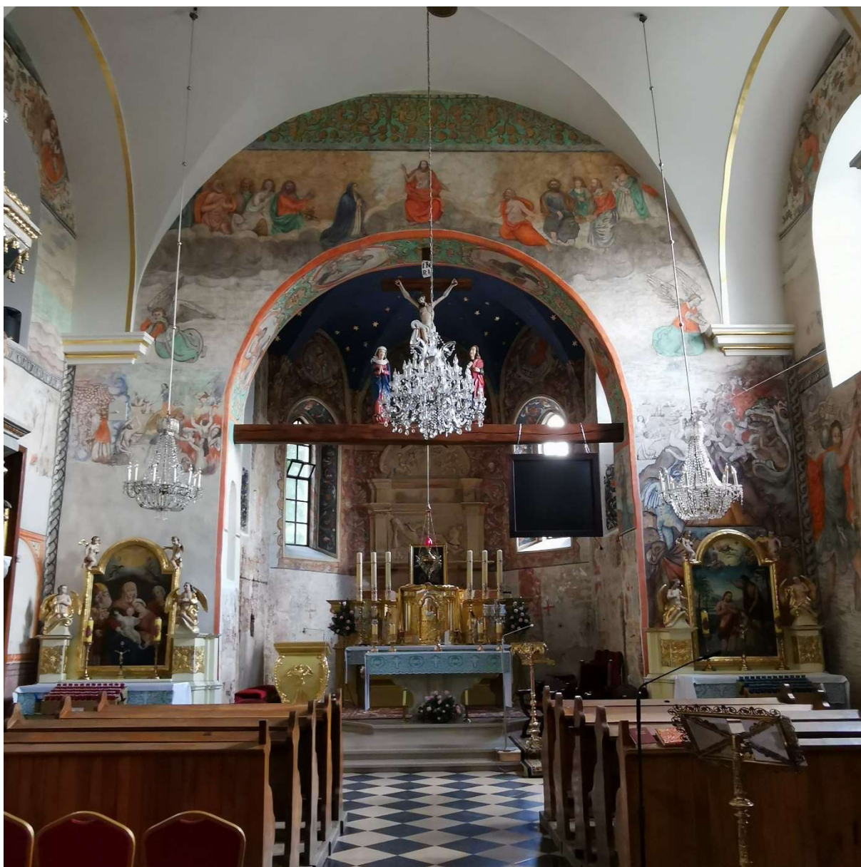
Kościół PW Wniebowzięcia Najświętszej Maryi Panny w Bestwinie

oraz na przebudowie wejścia i wyjścia na tereny wokół obiektu. Całkowity koszt inwestycji to 144 200 zł., poziom dofinansowania – 40%, beneficjentem jest Gminny Ośrodek Kultury w Bestwinie.